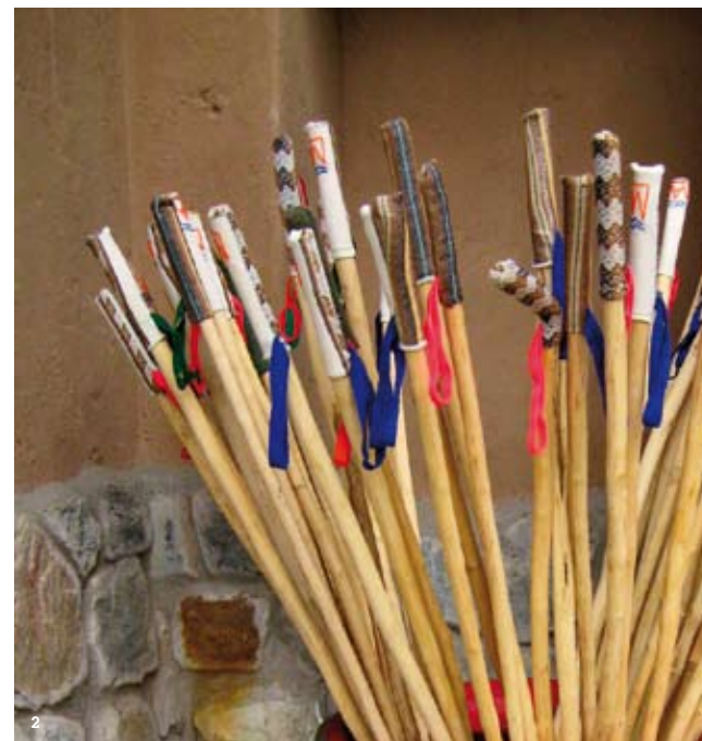
Glaciar y lago Humantay / Glaciers and Lake Humantay (1). Bastones para trekking esperan a los próximos aventureros / Walking sticks await the next group of trekkers (2).

Mi aventura comenzó a la altura de tres mil 400 metros, en Cusco, la muy bien conservada capital inca. Los cusqueños originales consideraban que su ciudad era el “ombligo” de la Tierra y su carácter histórico es evidente en los macizos muros que construyeron y que sirven de cimiento para los edificios que construyeron los españoles sobre ellos, al igual que en las calles empedradas, que se han conservado iguales por siglos.