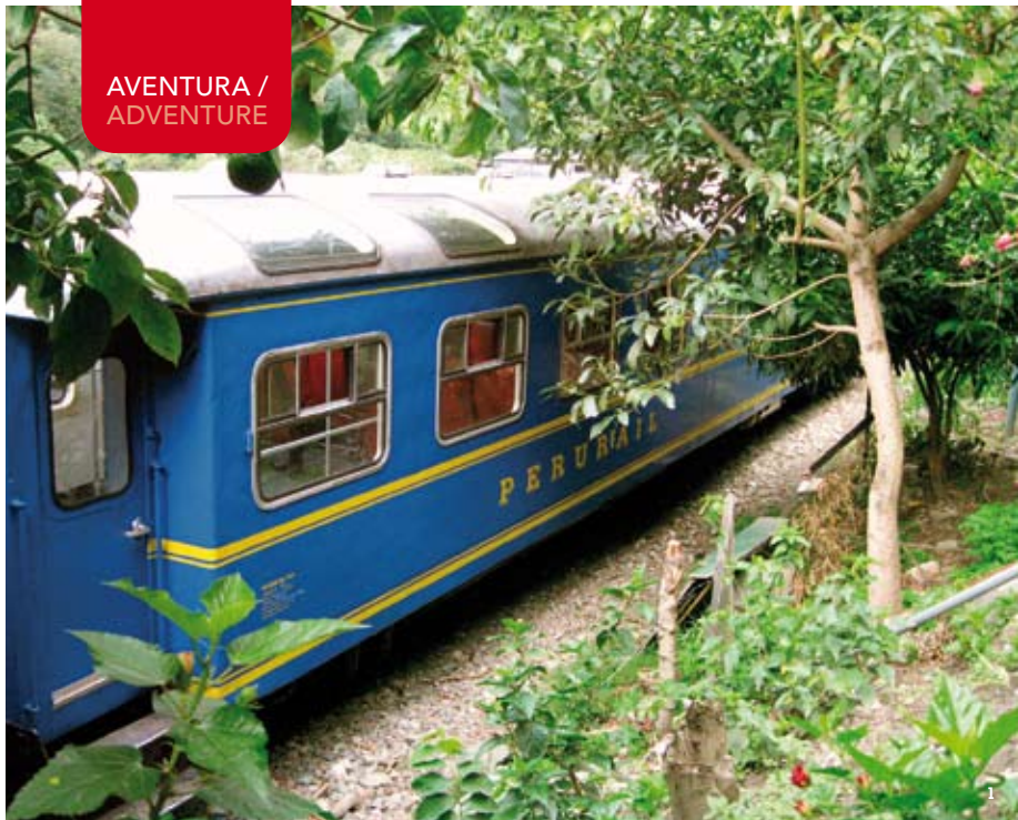
El tren para llegar a Aguas Calientes, camino a Machu Picchu / The train that leads to Aguas Calientes, on the way to Machu Picchu (1). Silencio y tranquilidad en una calle de Cusco / Silence and tranquility on a Cusco street (2).