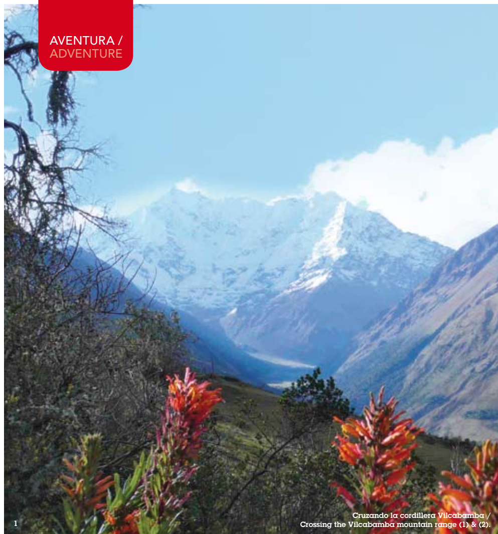
Cruzando la cordillera Vilcabamba / Crossing the Vilcabamba mountain range (1) & (2).