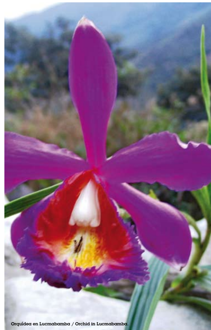
Orquídea en Lucmabamba / Orchid in Lucmabamba.

Vuelos LAN: A Cuzco todos los días desde Juliaca, Lima y Puerto Maldonado y 3 veces a la semana desde Tacna. /