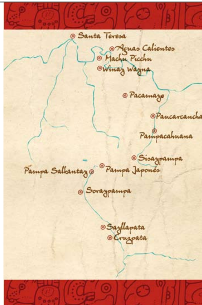
MAPA / MAP: ALEJANDRA ACOSTA

Edificio del Instituto Nacional de Cultura, Pachacutec cuadra 1. Precio: aproximadamente US$40 / The fee is approximately US$40.