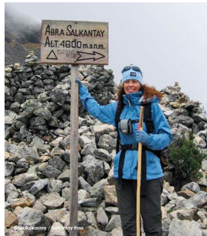
Paso Salkantay / Salkantay Pass

E n la tradición cultural andina, el espíritu o energía está en todas las formas naturales, en los árboles, plantas, ríos, rocas y los altos picos de las montañas. También está en nuestros cuerpos y en el aliento que me esfuerzo por recuperar, después de trepar por un paso entre montañas, a cuatro mil 650 metros de altura, en camino a Machu Picchu.