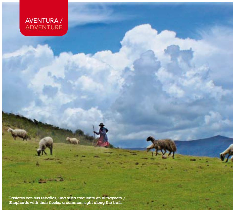
Pastores con sus rebaños, una vista frecuente en el trayecto / Shepherds with their flocks, a common sight along the trail.